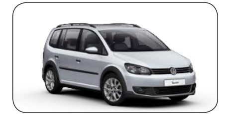
Volkswagen Touran Cross

Cirka pris: fr. 269 900 Bränsleförbrukning: 4,7 kg/100km Räckvidd: 50 mil (gas) + 15 mil (bensin) Effekt: 150 hk Euro NCAP krocktest: 5/5 Antal passagerare: 6