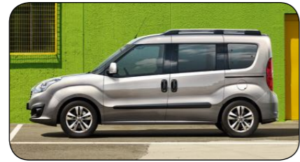
Opel Combo Tourer

Cirka pris: fr: 273 800 kronor Bränsleförbrukning: 4,7 kg/100 km Räckvidd: 45 mil (gas) + 19 mil (bensin) Effekt: 150 hk Euro NCAP krocktest: 5/5 Antal passagerare: 6