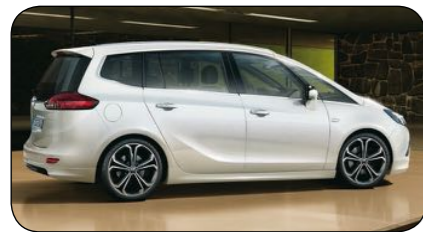
Opel Zafira Tourer

Cirka pris: fr: 330 900 kronor Bränsleförbrukning: 5,7 kg/100 km Räckvidd: 28 mil (gas) + 65 mil (bensin) Effekt: 173 hk Euro NCAP krocktest: 5/5 Antal passagerare: 4