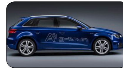
Audi A3 Sportback g-tron

Mer information om gasbilar och om biogas finns att läsa på www.biogasost.se