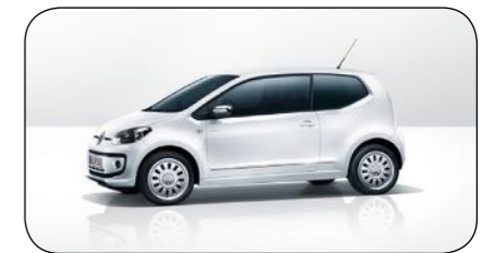
Volkswagen ECO Up

Cirka pris: fr. 207 500 kronor Bränsleförbrukning: 3,5 kg/100km Räckvidd: 43 mil (gas) + 94 mil (bensin) Effekt: 110 hk Euro NCAP krocktest: 5/5 Antal passagerare: 4