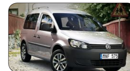
Volkswagen Caddy MaxiLife

Cirka pris: fr. 225 250 kronor Bränsleförbrukning: 5,7 kg/100km Räckvidd: 44 mil (gas) + 13 mil (bensin) Effekt: 109 hk Euro NCAP krocktest: 4/5 Antal passagerare: 4