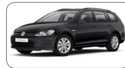
Volkswagen Golf Sportkombi

Cirka pris: fr. 164 500 kronor Bränsleförbrukning: 2,9 kg/100km Räckvidd: 38 mil (gas) + 22 mil (bensin) Effekt: 68 hk Euro NCAP krocktest: 5/5 Antal passagerare: 3