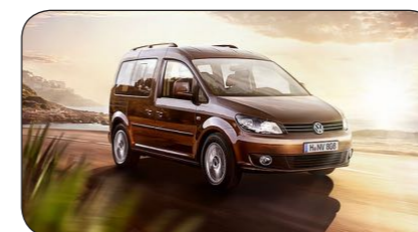
Volkswagen Caddy Life

Cirka pris: fr. 281 000 kronor Bränsleförbrukning: 4,8 kg/100km Räckvidd: 50 mil (gas) + 15 mil (bensin) Effekt: 150 hk (gas) Euro NCAP krocktest: 5/5 Antal passagerare: 6